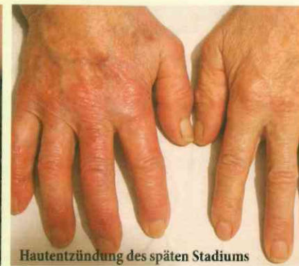
Hautentzündung des späten Stadiums

Achtung: Nur circa 50 Prozent aller Infizierten bilden die Wanderröte aus. Auch ohne Wanderröte kann eine Infektion stattgefunden haben. Man merkt das an einem Krankheitsgefühl wie bei einer beginnenden Grippe, zum Beispiel Abgeschlagenheit, Glieder- und Muskelschmerzen, Nackensteife. Noch nicht sprechende Kinder reagieren meist mit einer Wesensveränderung, mit Schonhaltung und Müdigkeit. Mehr Info: www.borreliose-bund.de