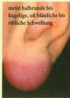
meist halbrunde bis kugelige, oft bläuliche bis rötliche Schwellung